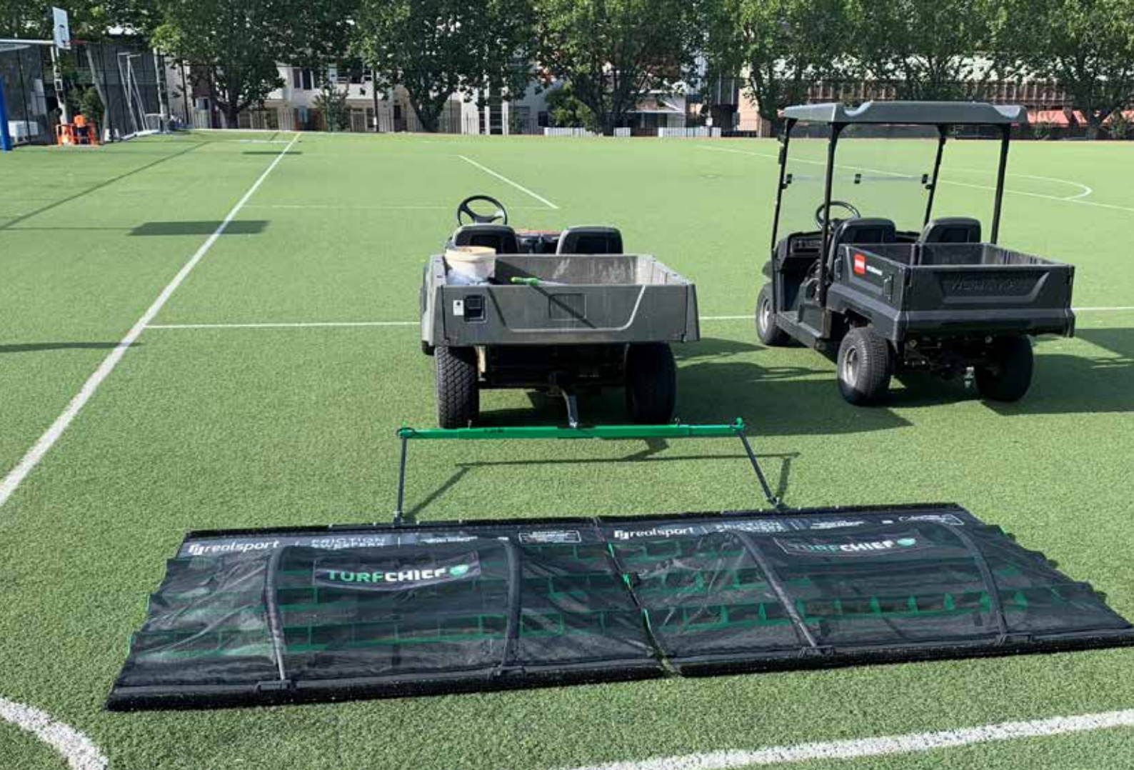
TURFCHIEF LARGEUR 207 CM