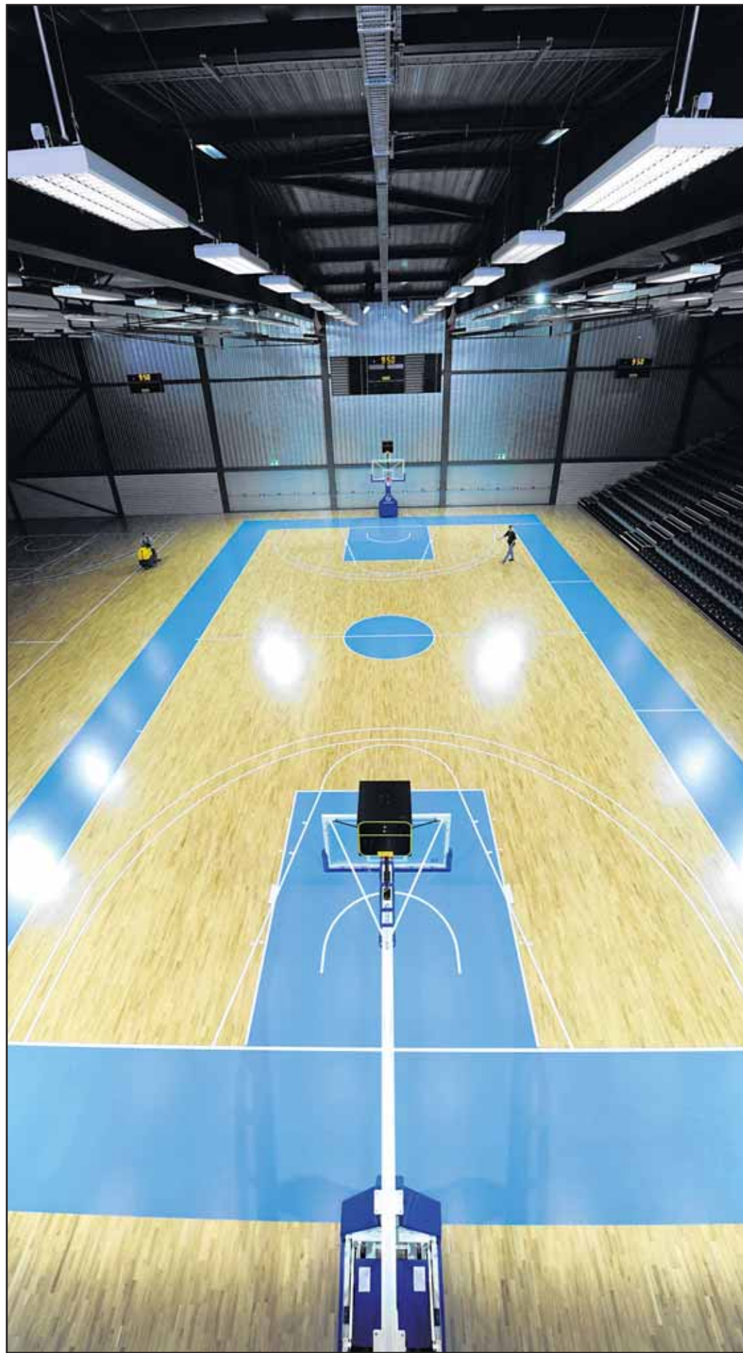
Le terrain central vu depuis la tribune fixe de 145 places. A droite et à gauche, deux tribunes amovibles pourront accueillir 1300 spectateurs chacune.