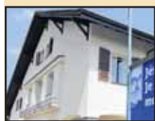
Le projet d'école a du plomb dans l'aile