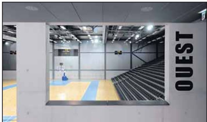
La halle omnisports reconnaissable à sa carapace de panneaux solaires. Elle abrite trois surfaces de basket et 3000 places en gradins déployables.

SAINT-LÉONARD • La halle omnisports inaugurée aujourd'hui à Fribourg s'ajoute à la deuxième piste de glace. Dans un concept d'aménagement qui remonte à 1990. Le tout financé par un partenariat public-privé.