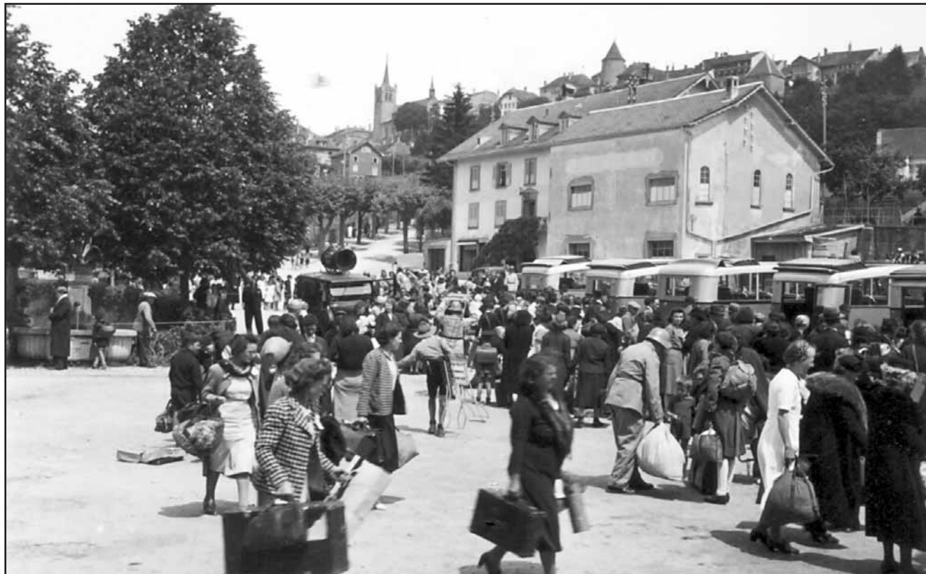
Des milliers de réfugiés civils français débarquèrent par vagues en gare de Romont à partir du 18 juin 1940.

IL Y A 70 ANS • Le 18 juin 1940, ce n'est pas l'appel du général de Gaulle qui plonge dans l'effervescence la population de Romont. Mais l'arrivée de 5000 réfugiés civils fuyant la percée allemande en France. «Je garde de cette soirée une vision dantesque», témoigne au-