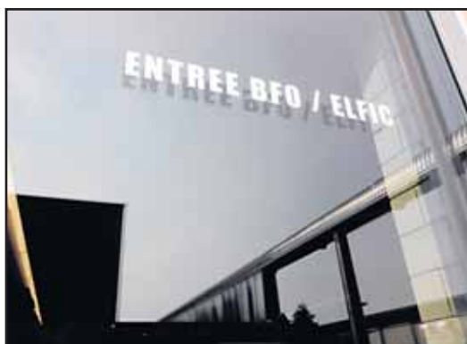
BFO et Elfic: l'entrée des artistes. CHARLY RAPPO

Qui dit nouvelle salle dit aussi arrivée de nouveaux sponsors? «La salle est quelque chose qui parle aux sponsors, mais la situation économique reste difficile», estime Kapsopoulos.